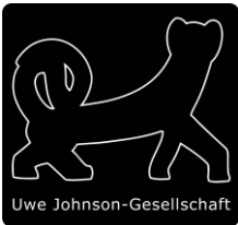
Uwe Johnson- Gesellschaft

Der Internationale Doktorandenworkshop der Uwe Johnson-Gesellschaft bietet Studierenden, Magistranden und Doktoranden alle zwei Jahre in Rostock ein Forum, um aktuelle Fragen zu Leben und Werk Uwe Johnsons zu diskutieren. Er lädt dazu ein, den Nachwuchs der Johnson-Forschung bei der Arbeit zu beobachten.